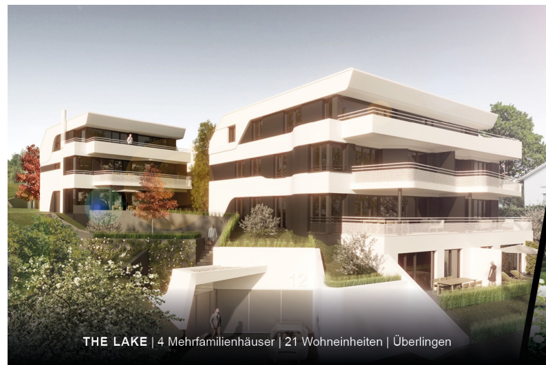
THE LAKE | 4 Mehrfamilienhäuser | 21 Wohneinheiten | Überlingen