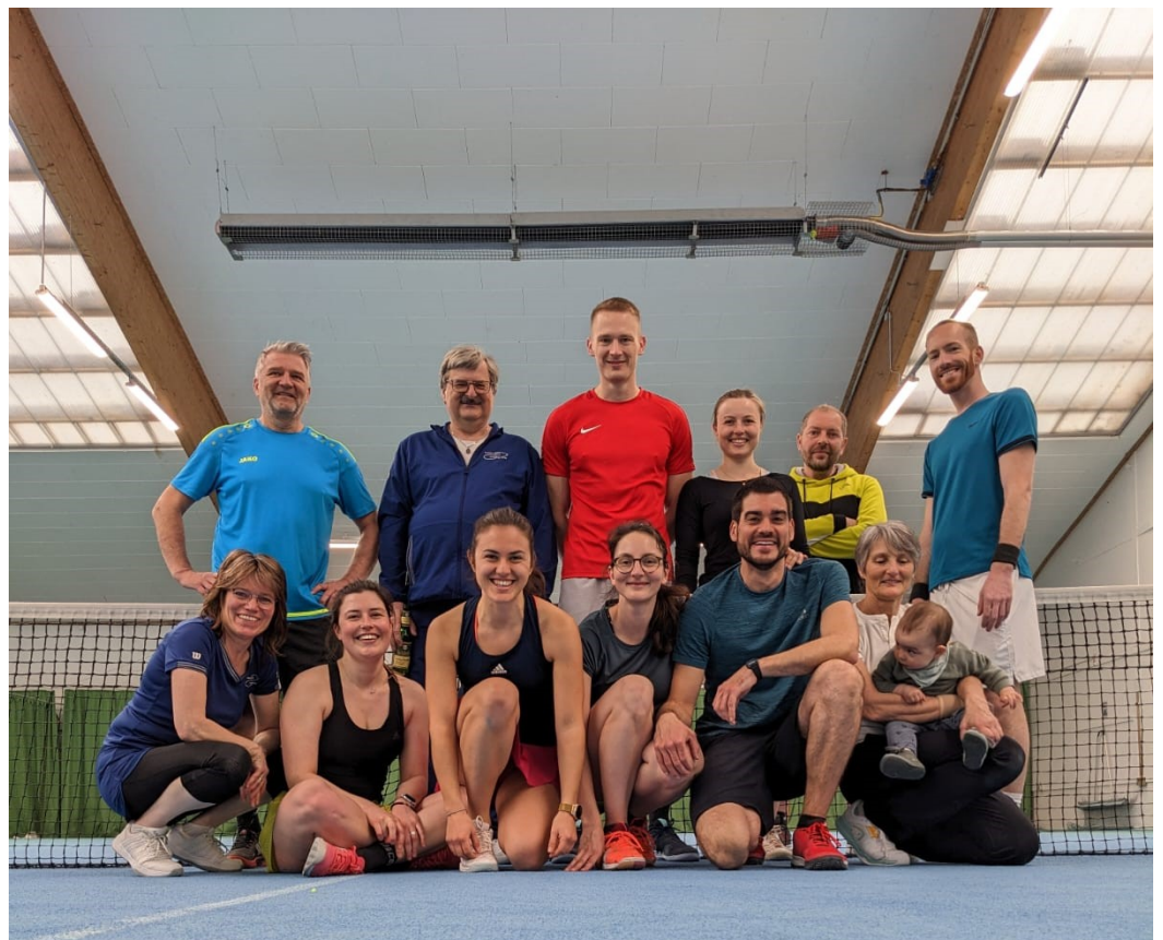
Beim Bändelesturnier zur Saisoneröffnung