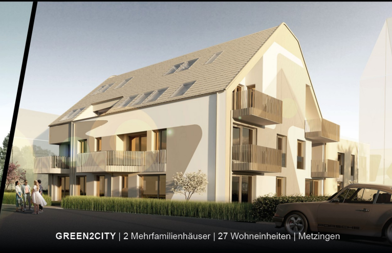
GREEN2CITY | 2 Mehrfamilienhäuser | 27 Wohneinheiten | Metzingen