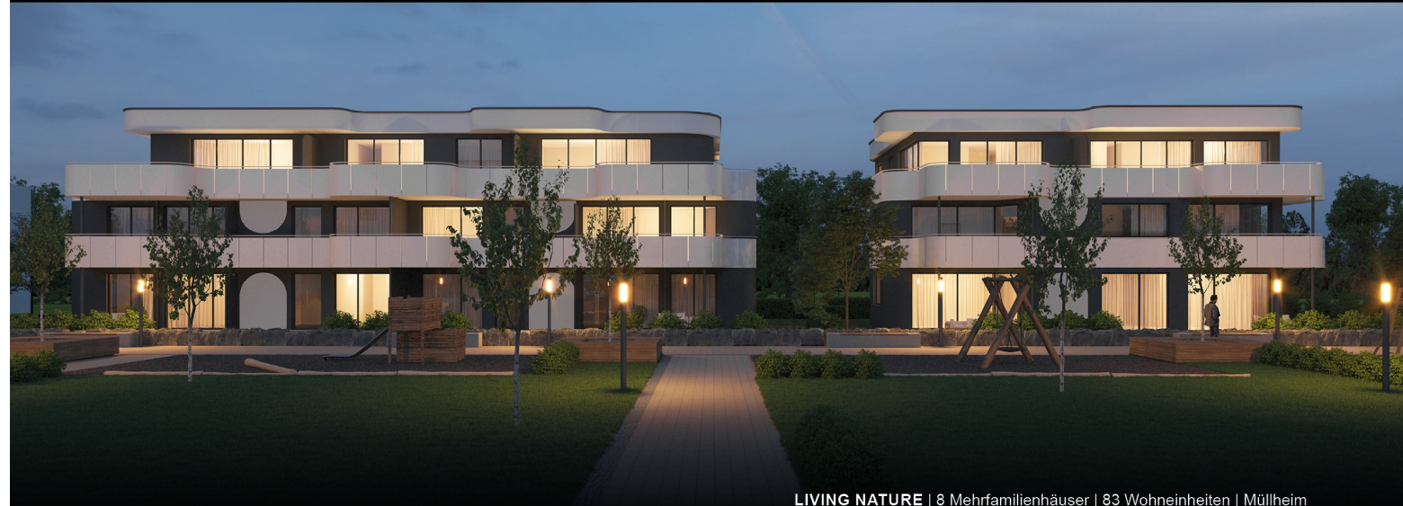
LIVING NATURE | 8 Mehrfamilienhäuser | 83 Wohneinheiten | Müllheim