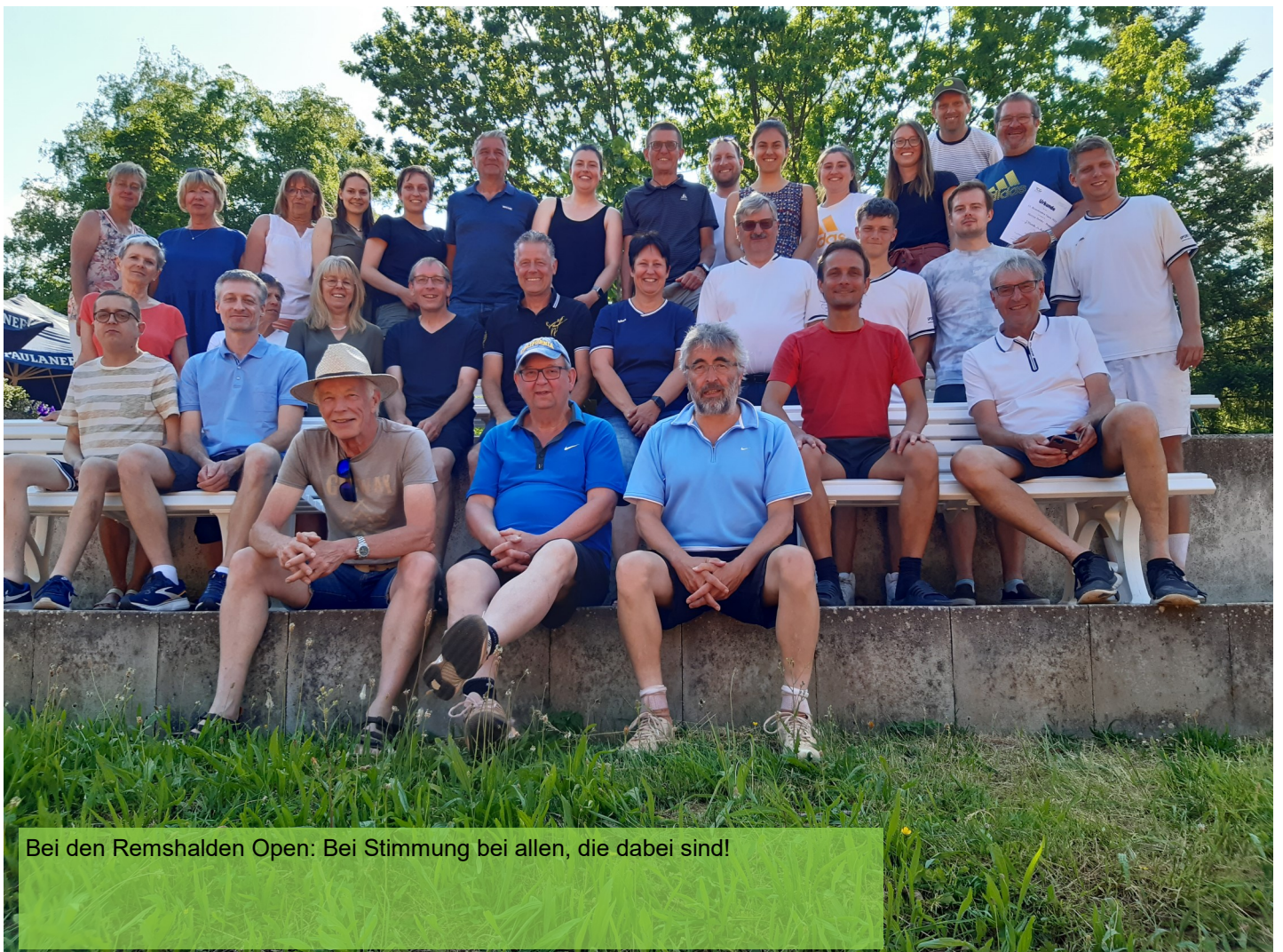
Bei den Remshalden Open: Bei Stimmung bei allen, die dabei sind!