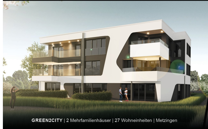
GREEN2CITY | 2 Mehrfamilienhäuser | 27 Wohneinheiten | Metzingen