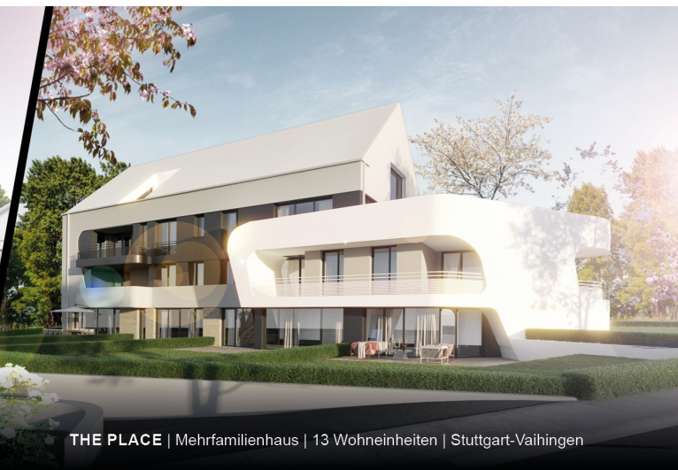
THE PLACE | Mehrfamilienhaus | 13 Wohneinheiten | Stuttgart-Vaihingen